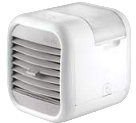
Homedics MYCHILL™ Climatizador personal portátil #8518965