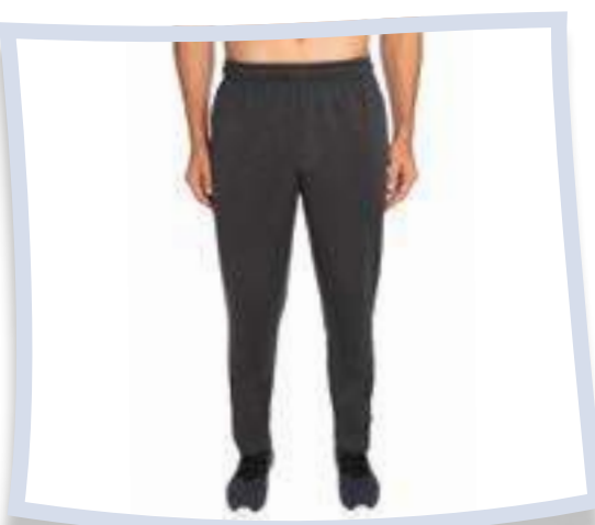
Champion Pantalón largo de entrenamiento #1204872