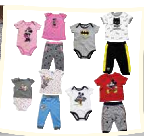
Varias Licencias Sets 3 piezas para niños #1282976