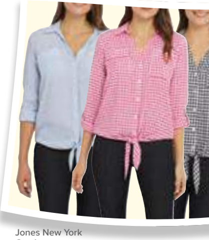
Jones New York Camisas top #1278302