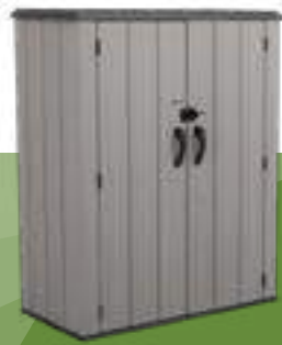
1900720 ARMARIO VERICAL