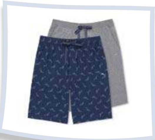
Tommy Bahama Pack pantalones cortos #8517377