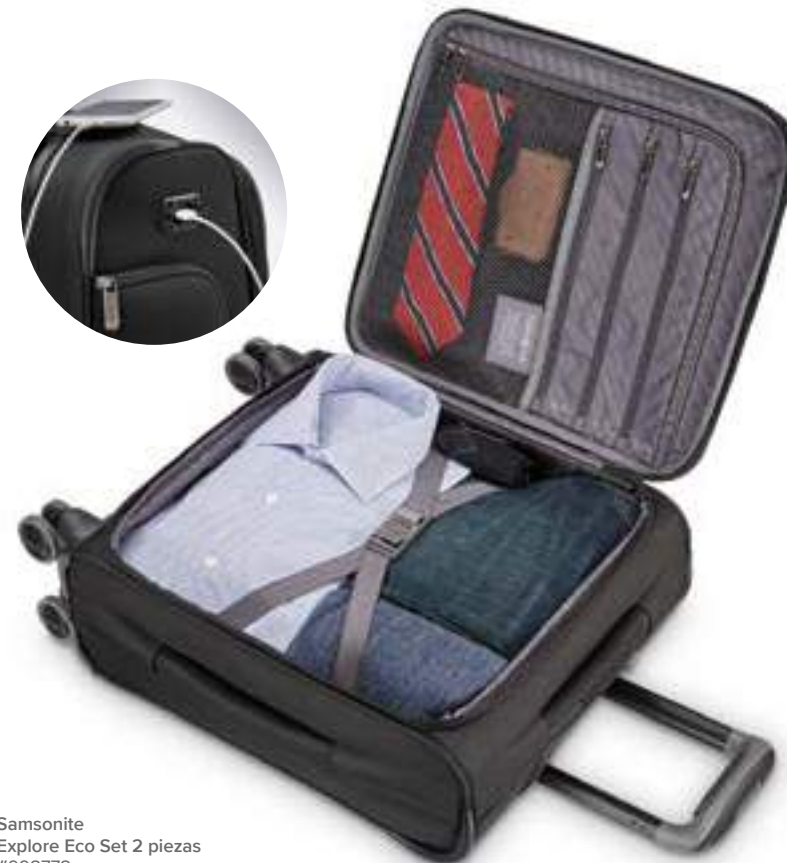
Samsonite Explore Eco Set 2 piezas #998778