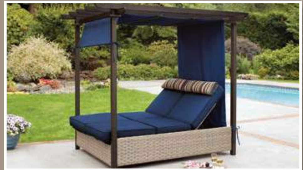
Paradise Retreat Lounge Exterior #1900615