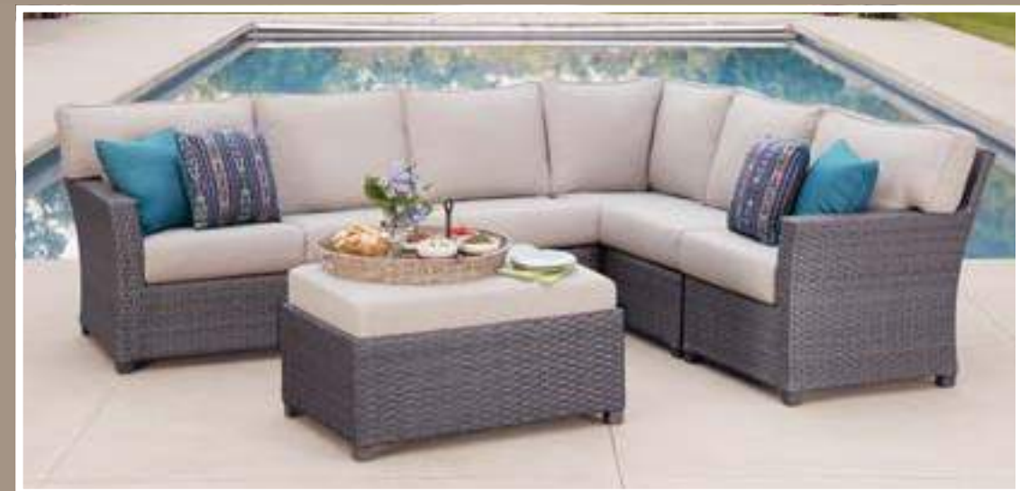
Westchester Conjunto de jardín 7 Piezas que incluyen 6 asientos y mesa central #1900755