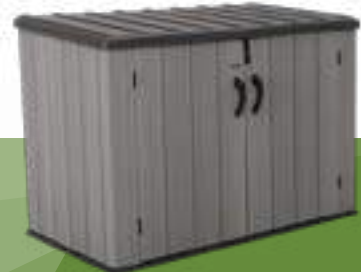
1900680 COBERTIZO DE ALMACENAMIENTO