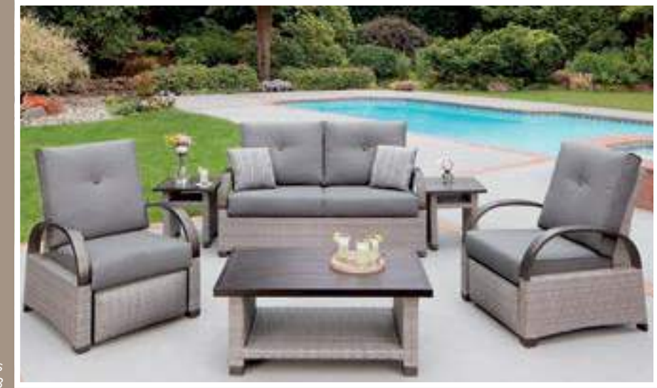
Mayfield juego de 6 piezas #1900673