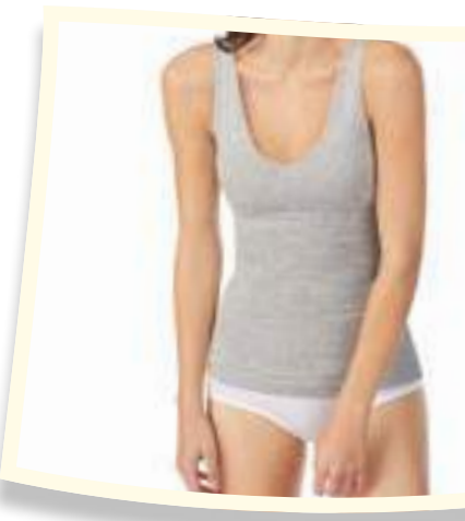
Jane & Bleecker Pack camiseta tirantes reversible 2 unidades #1187838