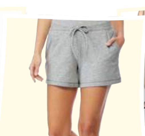
32 Degrees Pantalón corto #1265284