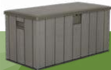
1031663 CAJA DE ALMACENAMIENTO