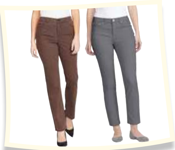
Bandolino Pantalón Sarabelle #142971