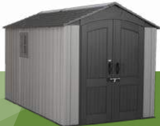
274022 2,13 m x 3,65 m CASETA DE RESINA