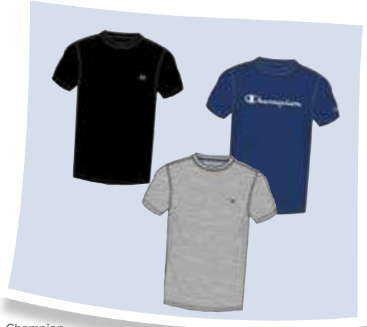
Champion Camisetas de manga corta #281487