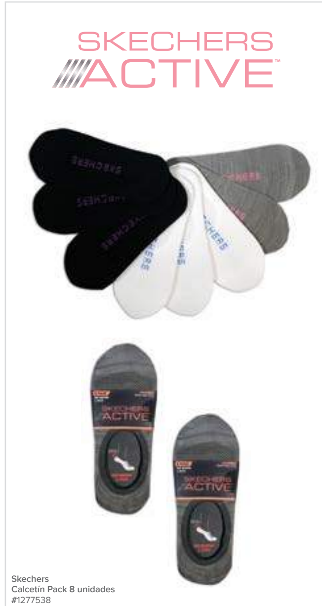
Skechers Calcetín Pack 8 unidades #1277538