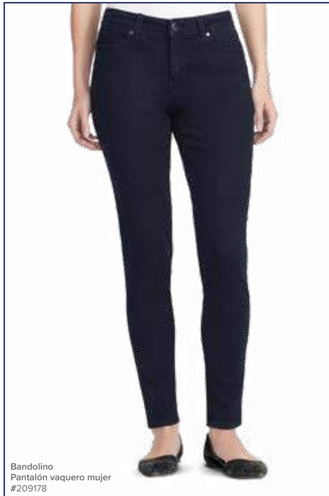
Bandolino Pantalón vaquero mujer #209178