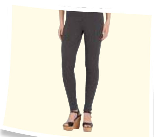
Hilary Radley Pantalón Mujer #801108