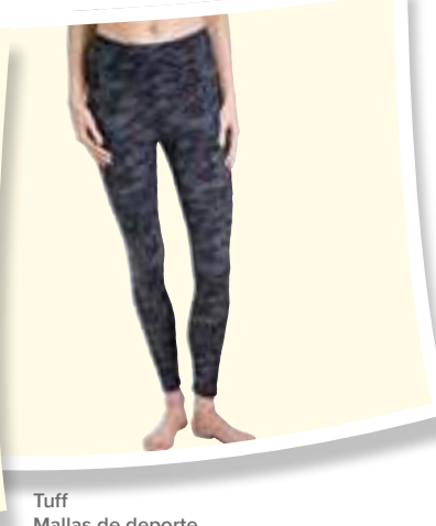
Tuff Mallas de deporte #1295985