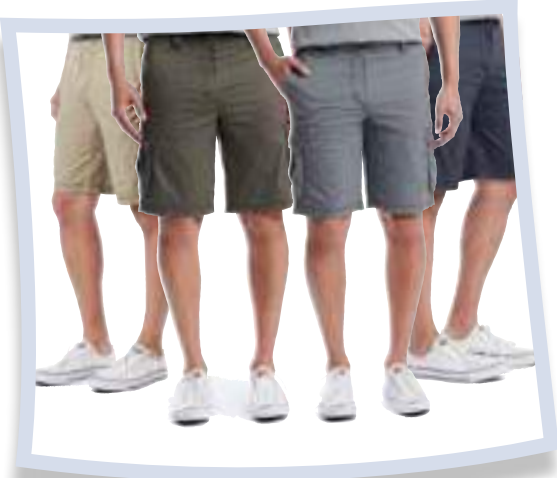
Unionbay Pantalones cortos Montego Cargo #1270882