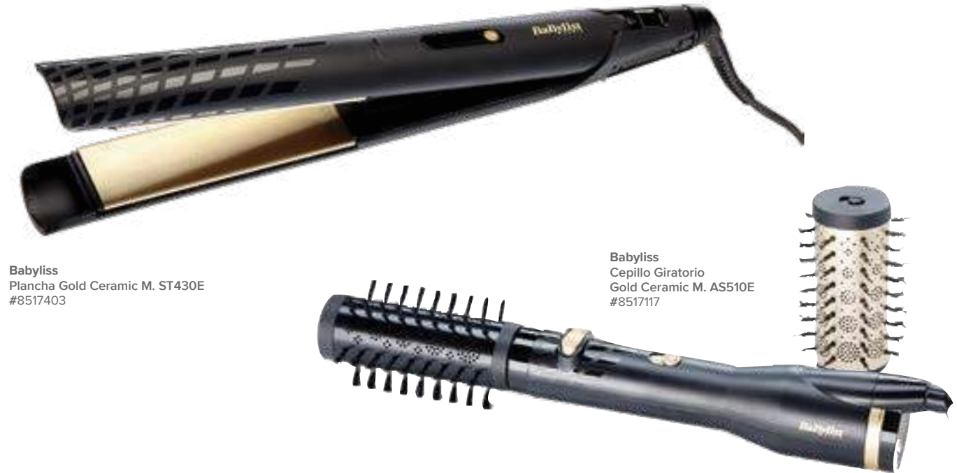
Babyliss Plancha Gold Ceramic M. ST430E #8517403