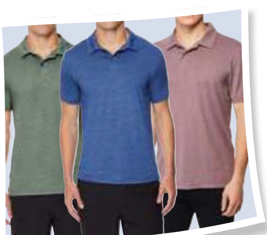
32 Degrees Polos de manga corta #1135030