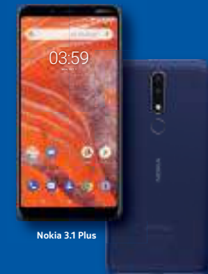
Nokia 3.1 Plus

Nuevo Nokia 3.1 plus en el que puedes confiar. Siempre aprendiendo, siempre actualizado.