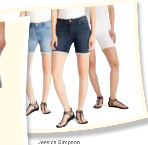
Jessica Simpson Pantalones cortos vaqueros #1276249