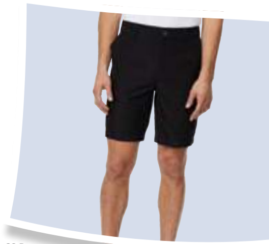
32 Degrees Pantalón corto Urban Tweed #275075