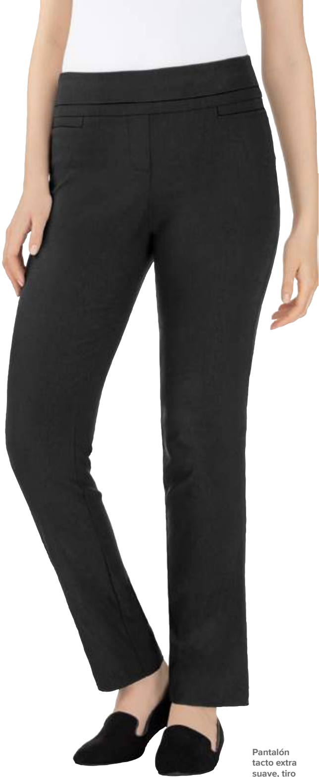
Pantalón tacto extra suave, tiro medio Slim fit #1343653