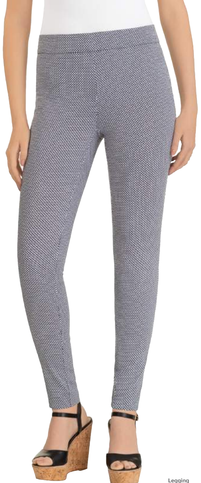
Legging compresivo, tiro medio #801108